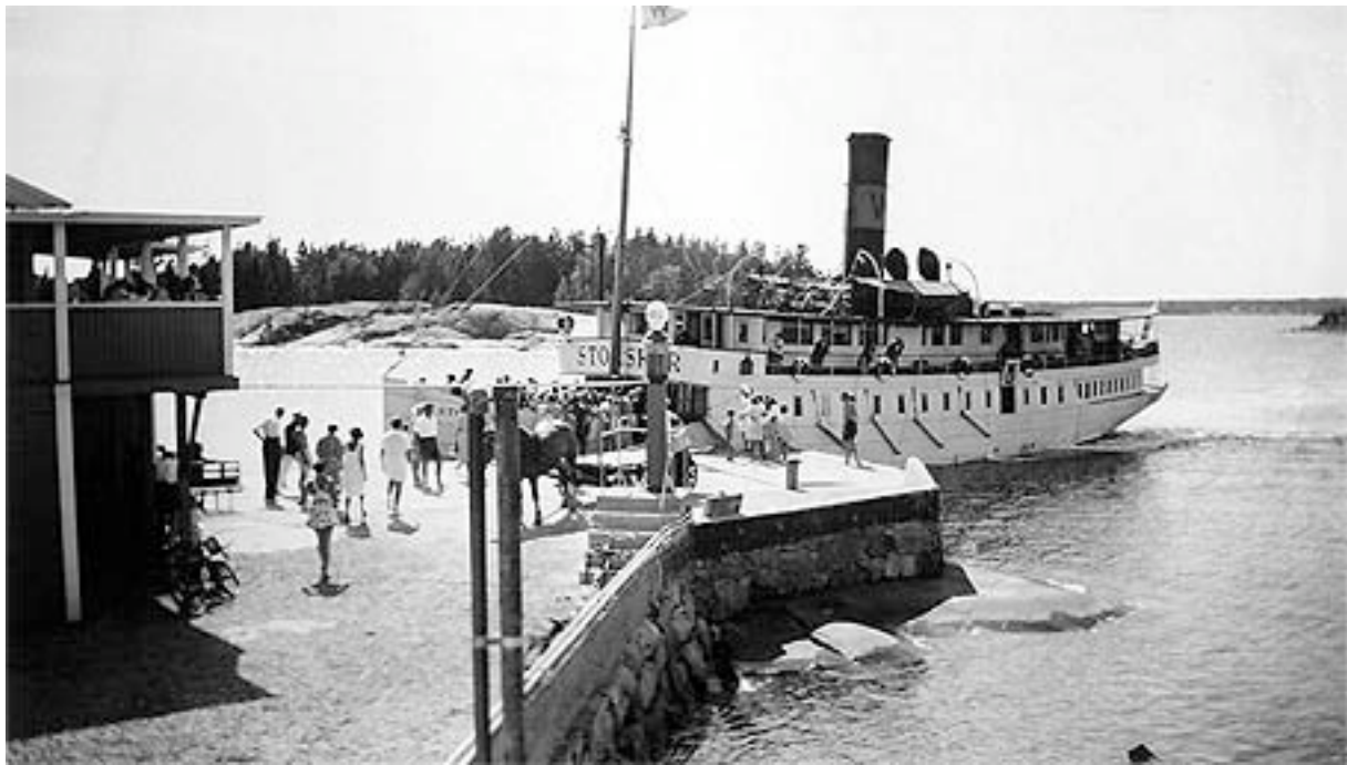
Bild från Arholma Handels storhetstid. Caféet på övervåningen är fullsatt, Storskär ligger inne. Den vackra men låga stenvuren står kvar. Den försvann vid stormen 1969. Nu ligger resterna bara som en stenhög ut mot sjön dold av den höga betongmur som finns där i dag.