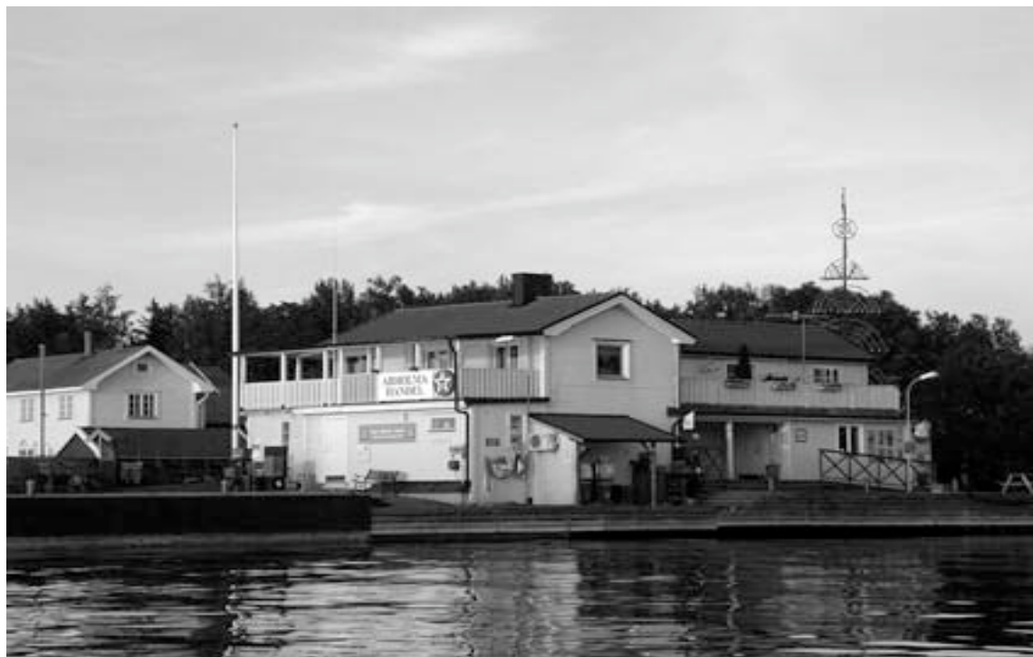
Arholma Handel 2003