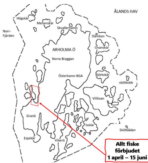
Översiktskarta Arholma Fiskevårdsområde